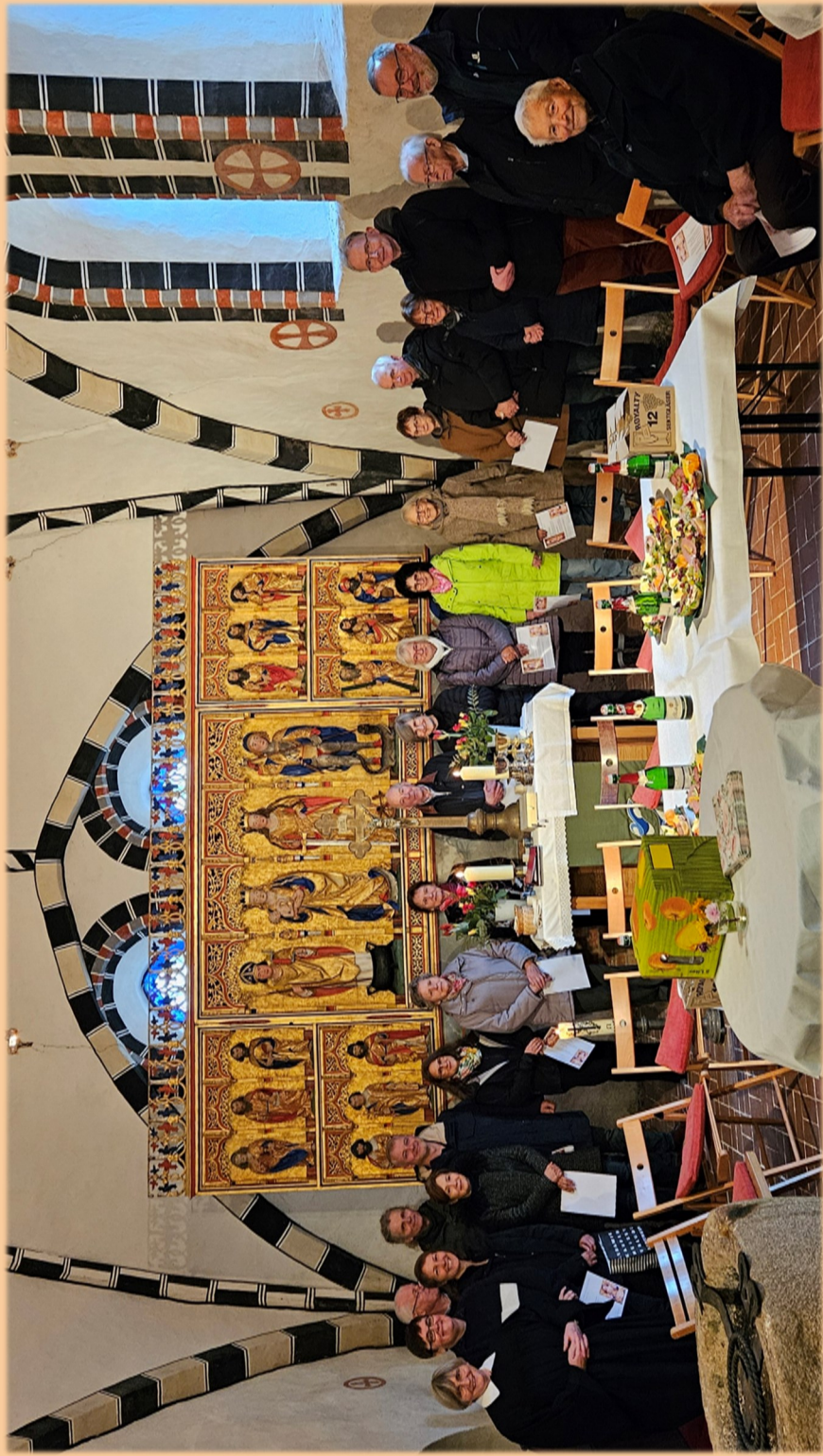
Gottesdienst mit Festakt anlässlich der Altarrestaurierung in der Bernitter Kirche am 9. November 2025